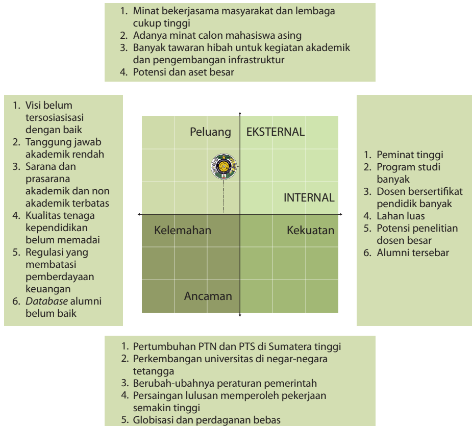
Gambar 3.1 Matriks Pemosisian USU

Kondisi USU yang berada pada posisi kuadran 3 menunjukkan bahwa USU memiliki peluang untuk menjadi universitas terkemuka nasional dengan akreditasi tertinggi dan menjadi universitas berstandar internasional. Akan tetapi, di lain pihak USU menghadapi beberapa kendala dan memiliki kelemahan internal. Titik berat strategi untuk USU adalah melakukan upaya meminimalkan masalah-masalah internal melalui konsolidasi dan pemahaman yang sama terhadap visi dan misi USU sehingga dapat merebut peluang yang lebih baik.