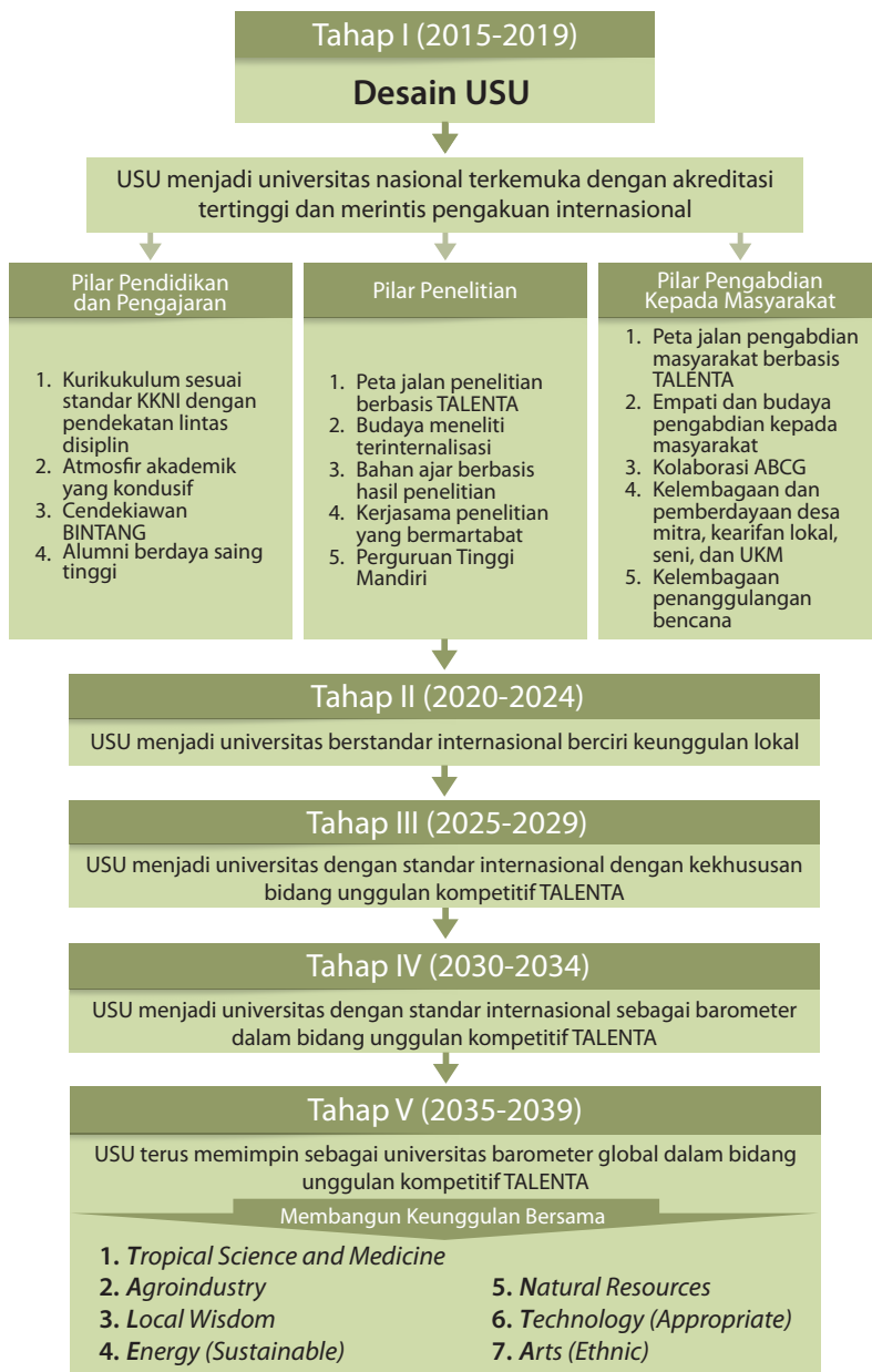
Gambar 2.1 Desain USU 2015-2019