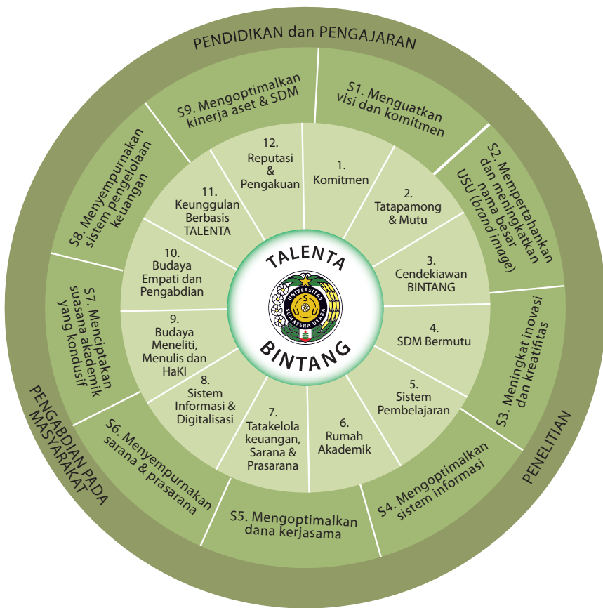
Gambar 4.1 Sinergisitas Tri Dharma Perguruan Tinggi, strategi dan program kerja dengan menginternalisasi tata nilai utama BINTANG untuk mencapai keunggulan bersaing TALENTA